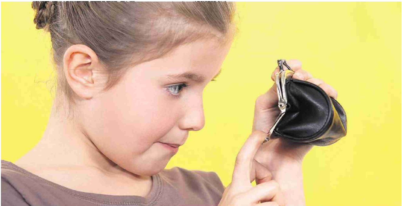
Genau ins Portemonnaie schauen: Der Bund empfiehlt, dem Nachwuchs möglichst früh ein Bewusstsein für Geld zu